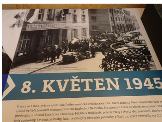
V noci ze 7. na 8. května narazila Praha americká veličkovská mise, která měla za úkol informovat klíčové armády ve Velichovkách o bezpodmínečné kapitulaci Německa. Na situaci v Praze se ale nic nezměnilo. Těžiště bojů se přesunulo do oblasti Smíchova, Pankráce, Michle a Holešovic, pokračovaly i čtvrtý den povstání. Navíc se boje rozhořely i v centru Prahy, kam postupovaly německé jednotky z Karlína, které zadržely na Starém nábřeží.