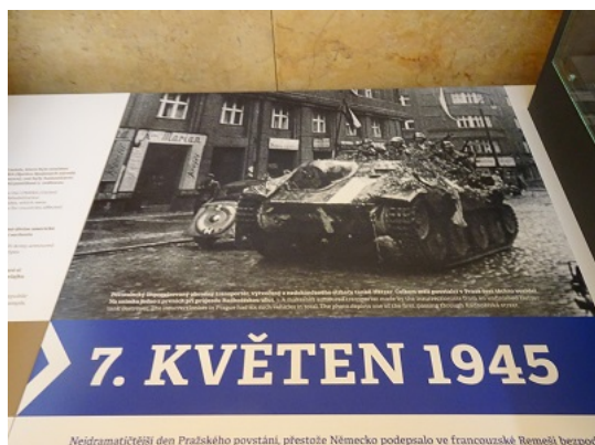
Nejdramatičtější den Pražského povstání, přestože Německo podepsalo ve francouzské Reměši bezpodmínečnou kapitulaci, která znamenala konec druhé světové války. Přestože byla povstání v Praze již prakticky ukončeno, bojovníci pokračovali v boji proti vojskům Rudé armády, která se snažila dobýt Prahu. Přestože byla povstání v Praze již prakticky ukončeno, bojovníci pokračovali v boji proti vojskům Rudé armády, která se snažila dobýt Prahu.