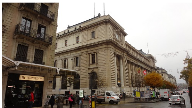
Ženevská hlavní pošta na ulici Rue de Mont-Blanc