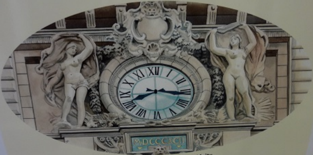
Horloge nord «Le Jour et la Nuit»