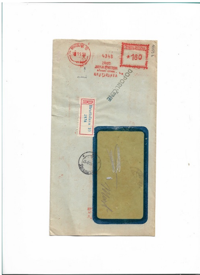
Otisk ze dne 20. 6. 60