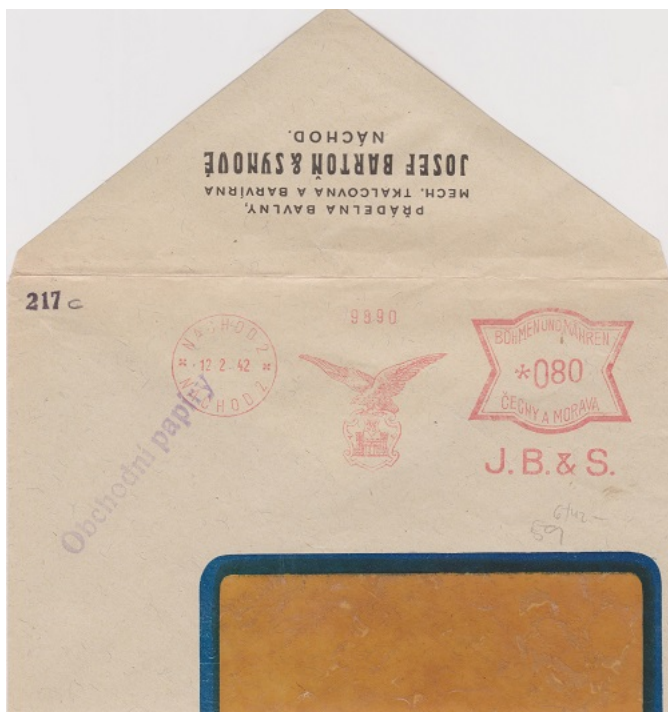
Otisky z katalogu Di Casoly/Leiše pro doplnění a podrobnější studium sběratelů