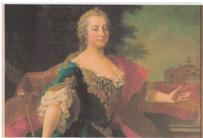
Císařovna Marie Terezie

Zdroje obrázků: www.i60.cz + wikipedia.org