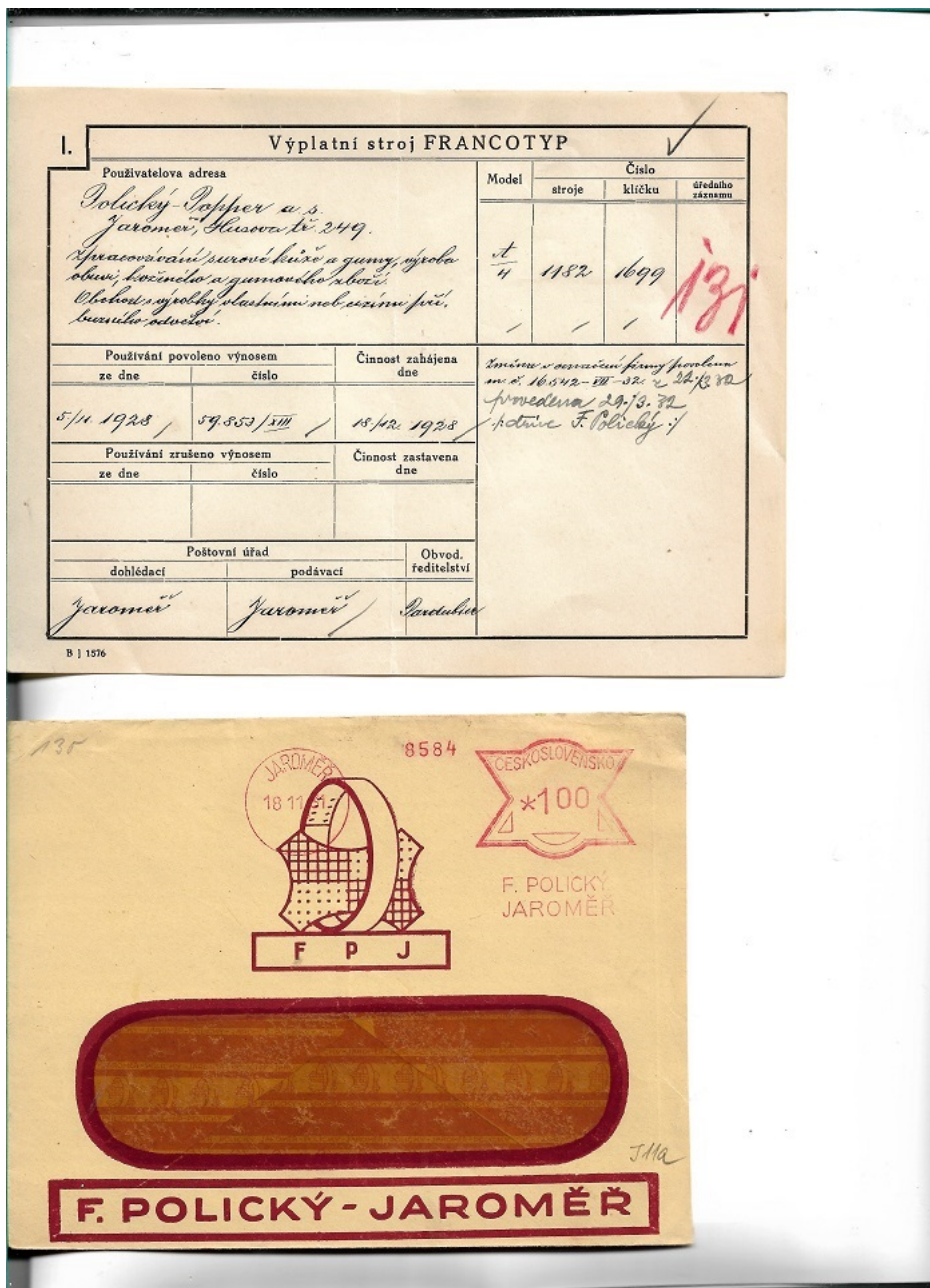
1. varianta (uvedeno pod a/)

2. varianta (uvedena pod b/) doplněna poštou prošlou celistvostí