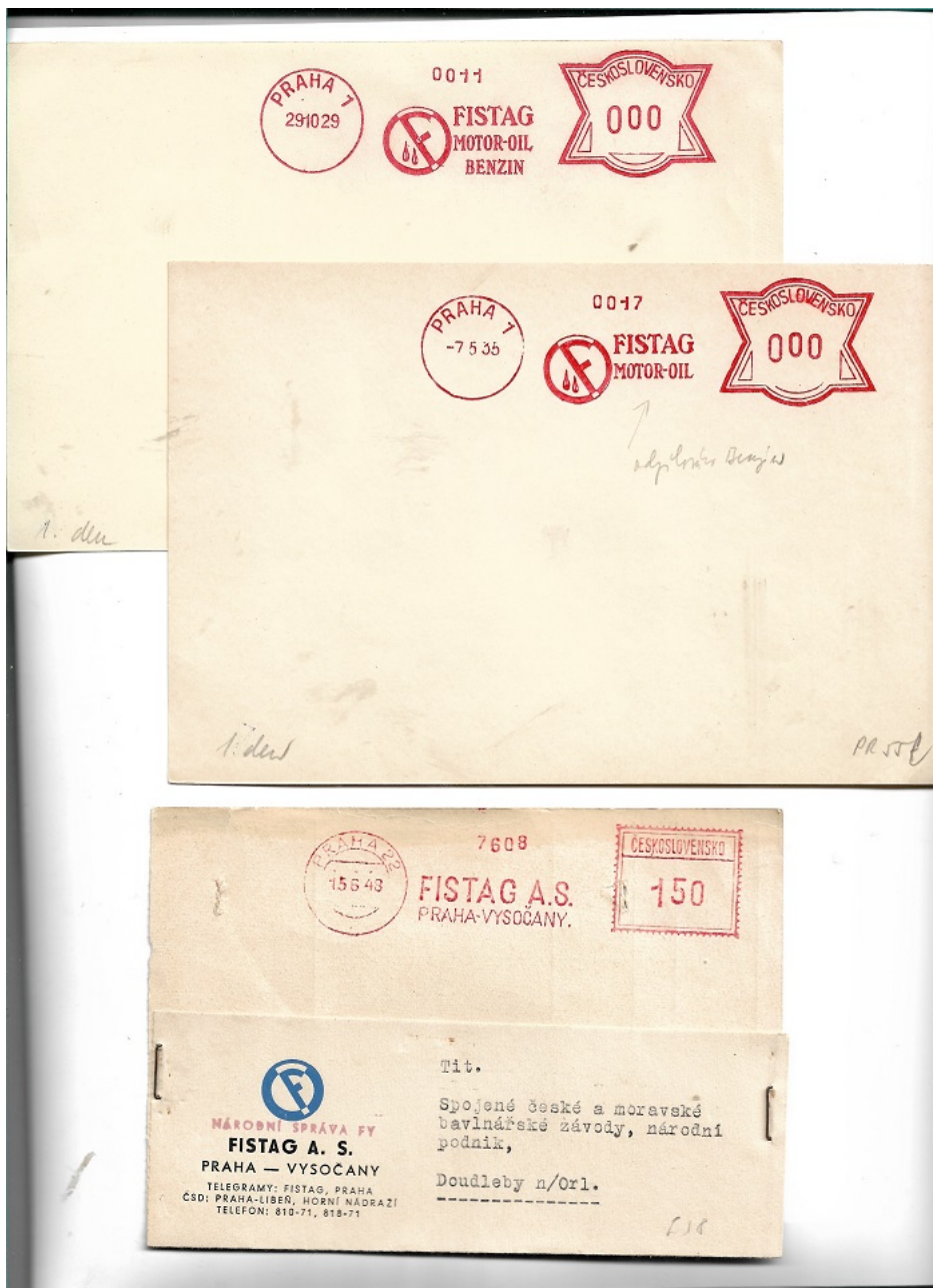
První otisk FISTAGu z 1. republiky (1. den a srovnání s otiskem na poštu prošlé celistvosti z roku 1931)