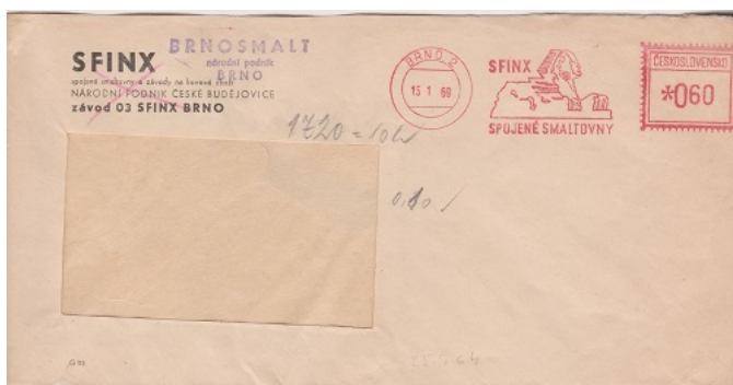
BRNOSMALT n. p., Brno, rok 1970